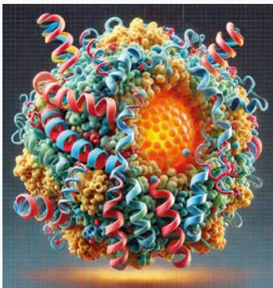
Obr | Molekula lipoproteínu(a)

Lp(a) sa správa ako aterogénny lipoprotein, ktorý podporuje tvorbu aterosklerotických plakov v stenách ciev. Obsahuje cholesterolové estery a oxidované fosfolipidy, ktoré sa hromadia v endotelových bunkách a podporujú zápal a poškodenie cievného endotelu. Tieto pláty narúšajú normálny