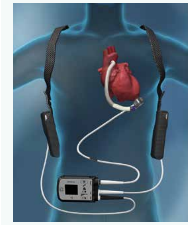
Obr | Mechanická srdeční podpora HeartMate 3 (použito se svolením společnosti Abbott U.S.)