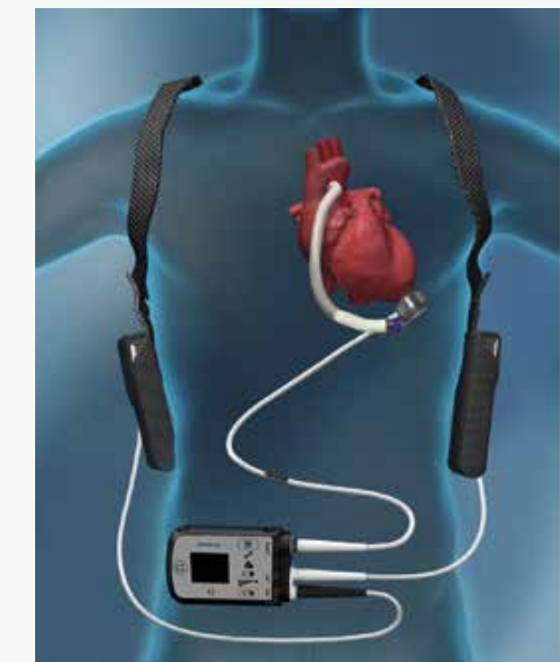
Obr | Mechanická srdeční podpora HeartMate 3 (použito se svolením společnosti Abbott U.S.)