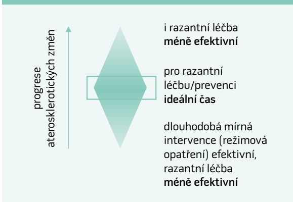
Schéma 1. Optimální časování léčby aterosklerotických změn